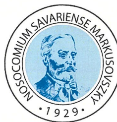
VAS VÁRMEGYEI MARKUSOVSKY EGYETEMI OKTATÓKÓRHÁZ

Székhely: H-9700 Szombathely Markusovszky u. 5. Telephely: (mellékletben részletezve)